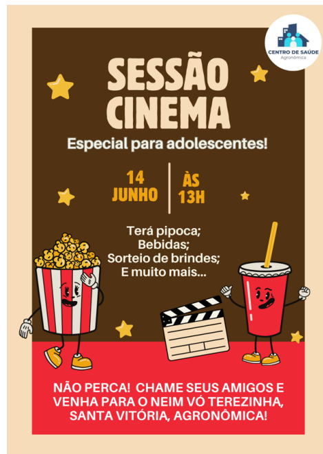
Figura 1. Card de divulgação para convite dos adolescentes à atividade.

práticas educativas inovadoras e intersetoriais, esta experiência contribui para a construção de ambientes seguros, acolhedores e promotores de autonomia, consolidando-se como uma ferramenta potente para qualificar as ações da APS.