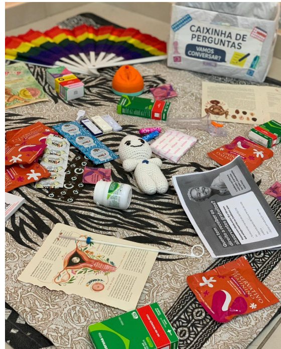
Figura 4. Roda de conversa com adolescentes sobre saúde sexual e reprodutiva