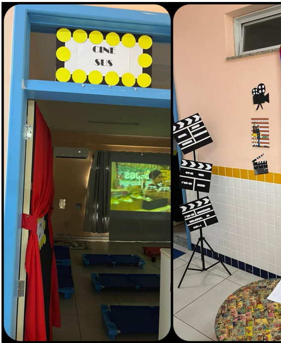
Figura 2. Ambientação da sala transformada em cinema para a exibição do filme Juno.