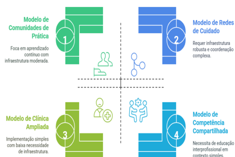
Figura 2. Modelos de Equipes de Saúde Colaborativas

Modelo de Competência Compartilhada (Reeves et al., 2010), possui como elementos-chave o foco no desenvolvimento de competências comuns, as zonas de sobreposição de saberes e a prática reflexiva conjunta. Mas, para implementação requer programas de educação interprofissional e necessita de tempo para construção de confiança entre trabalhadoras/es.