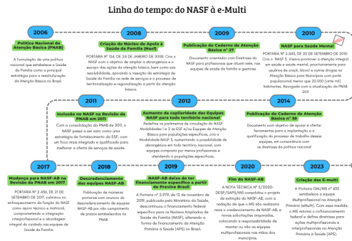
Figura 1: Principais normativas e marcos da Atenção Multiprofissional na APS